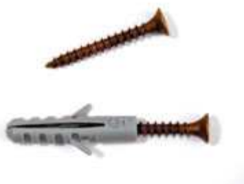
Vrutky s hmoždinkami jsou součástí balení