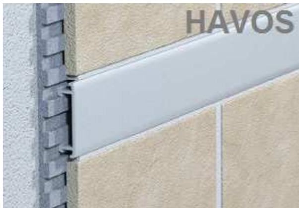
Listela ALEXO- Al elox

Údržba profilů by měla být prováděna pouze správně naředěnými neagresivními čisticími prostředky, profily by však neměly být dlouhodobě vystaveny působení přípravku. Nezbytností je profil po každé údržbě omýt dostatečným množstvím čisté vody, aby na povrchu nezůstaly zbytky chemikálií. Mezi agresivní čisticí prostředky patří např.: prostředky na odstraňování vodního kamene, čištění odpadů, čištění cementových usazenin, přípravky na odstraňování připečených nečistot ze sporáků apod.