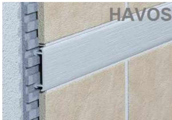
Listela ALEXO- Al elox kartáčovaný